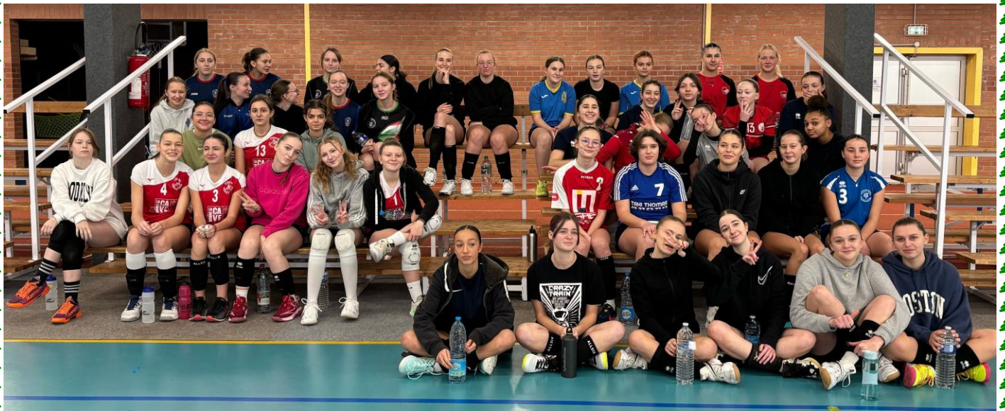
Les cadettes à Feignies