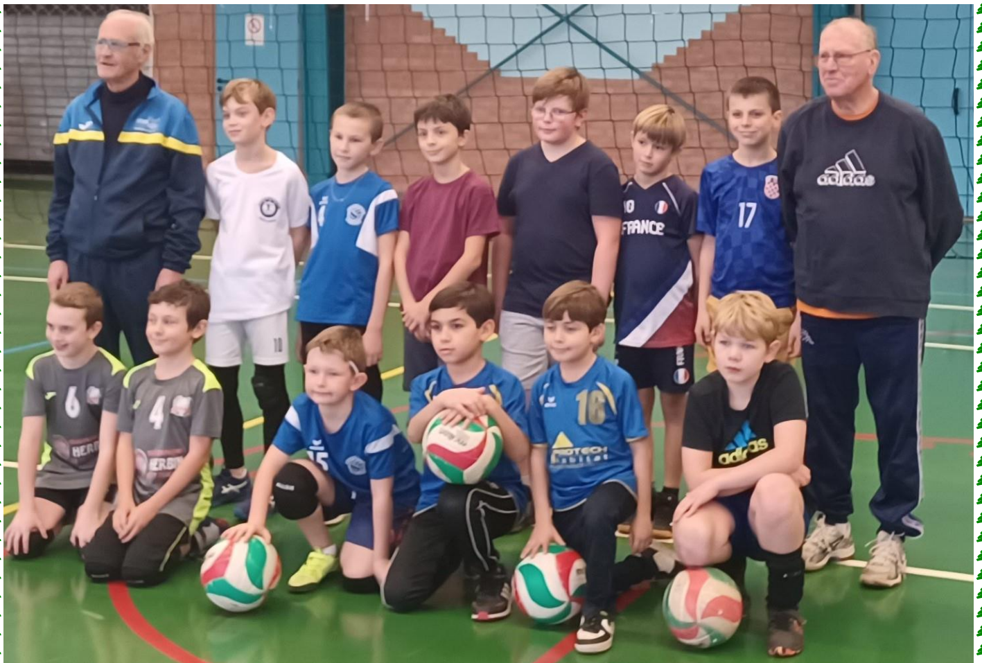
Les poussins à Assevent